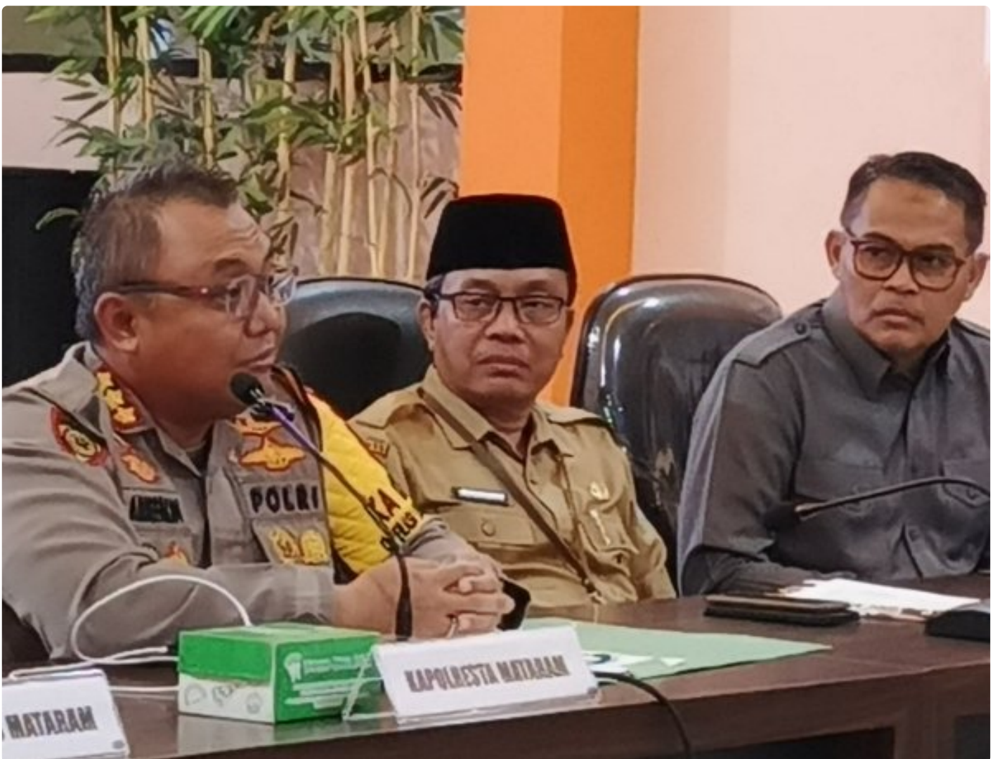
Kapolresta Mataram (Kiri) saat memimpin Konferensi pers akhir tahun, Selagi (31/12/2024)

MATARAM, NTB – Polresta Mataram mengakhiri tahun 2024 dengan menggelar Konferensi Pers Akhir Tahun, sebuah forum transparansi untuk memaparkan capaian dan inovasi yang telah dilakukan selama satu tahun. Kegiatan yang